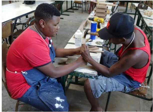
L'entraide fait partie de l'éducation de nos jeunes