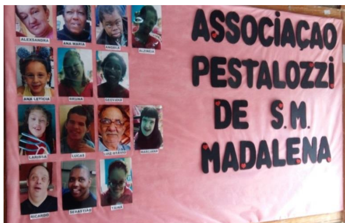
Les pensionnaires de l'institut Pestalozzi

Une grande partie de nos locaux est utilisée par l'Institut Pestalozzi ce qui est une excellente solution, étant donné que, actuellement nos cours de formation sont réduits à deux, voire trois cours de peinture dans l'année. Cette situation est due au manque de personnel formateur (la PMSMM, comme toutes les autres préfectures, est dans une situation financière extrêmement difficile actuellement). Nous attendons avec impatience que le nouveau gouvernement brésilien daigne allouer des fonds de récupération pour cet État !