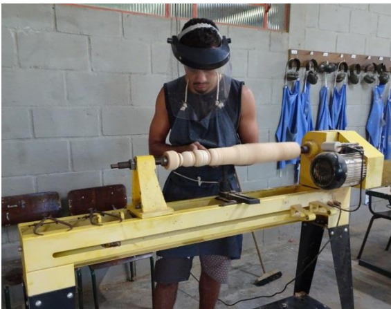
Apprenti de 4 ème année au tour à bois

Pour terminer, quelques photos intéressantes réalisées lors de cette visite de trois jours.