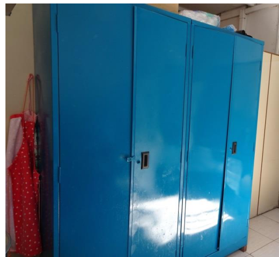
Le côté gauche de la cuisine avec Karine.....et les vieilles armoires qui ont été simplement repeintes