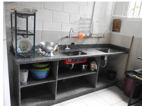
Récupération de notre ancien frigidaire et de notre cuisinière à gaz (par souci d'économie)

Enfin nous avons profité de ces travaux pour également construire une annexe de rangement derrière le bâtiment. Nous avons aussi fermé toute la partie arrière pour éviter des vols et, dans un proche avenir, nous aimerions également fermer toute l'enceinte par sécurité.