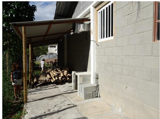
Nouveau couvert de rangement pour le bois ainsi que la cage pour l'entrepôt des bonbonnes de gaz de notre cuisine