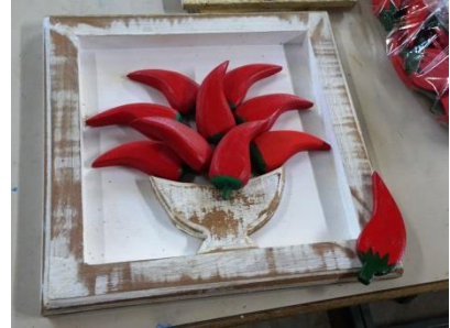
Artisanat réalisé par nos jeunes de l'école de menuiserie